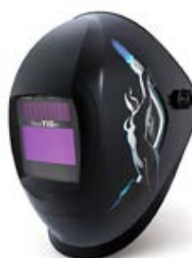
40 23 61 – Torchdancer