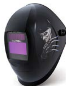
40 23 62 – Weldy