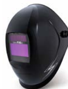
40 23 64 – Thunder