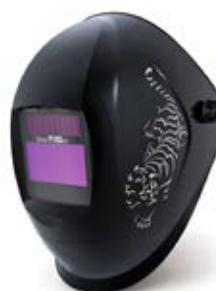
40 23 63 – Tiger