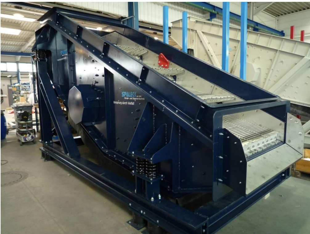
Vibrační síto společnosti Spaleck GmbH & Co. KG

Vzhledem k tomu, že se vibrační síto často nachází na počátku delšího výrobního procesu, přináší jeho neplánovaná odstávka a s ní spojený výpadek výroby značné náklady. Společnost Spaleck GmbH & Co. KGU proto hledala spolehlivé řešení on-line monitorování, které by jí umožňovalo zvýšit disponibilitu vlastního vibračního síta a tím i disponibilitu strojních zařízení zákazníků. V drsných podmínkách, které v provozním prostředí vibračních sít panují, se přístroj FAG SmartCheck osvědčil a dosáhl ve všech ohledech přesvědčivých výsledků. Inteligentní systém měření umožnil identifikovat nejdůležitější provozní stavy vibračního síta a zajistit tak potřebnou disponibilitu zařízení. Protože samotné vibrační síto způsobuje vysokou hladinu vibrací, je obzvláště důležité vypořádat se s potřebou vyfiltrovat ty správné informace, které jsou nezbytné k diagnostice poškození. To dokáže jen velmi málo zařízení, přičemž se většinou jedná o mnohem dražší systémy. Přístroj FAG SmartCheck však bodoval nejen díky přesnému a spolehlivému monitorování, ale i zásluhou jednoduchého uvedení do provozu a snadné obsluhy. Tento přístroj například umožňuje využívat více než 20 standardně předdefinovaných charakteristických parametrů, které se také postaraly o bezproblémové nasazení v provozu společnosti Spaleck.