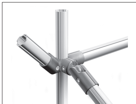
Různá tvarová spojení trubkových profilů

Pro plánování složitějších montážních pracovišť či regálů je projektantům a konstruktérům k dispozici software MTpro Layout designer, který podporuje přímý export 3D modelů do všech běžných CAD programů a automaticky generuje kusovník použitých dílů. Software disponuje zástavbovou logikou, která podporuje uživatele při sestavování celých systémů. Sestavování metodou „táhni, pusť, uchoť“ maximálně usnadňuje práci s programem. MTpro Layout Designer lze instalovat mimo jiné i na platformu Windows 7 (32/64 bit).