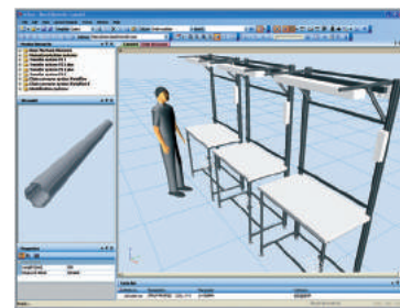
MTpro Layout Designer

Masivní spojující prvky jsou vyrobeny ze zinku tlakovým litím. Vnitřní výstupky ve spojkách zajišťují pevnou polohu trubky ve spojce. Montáž spojek se provádí jednoduše šestihranným klíčem. Pomocí pouhých pě-