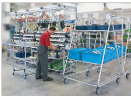
Možnosti využití trubkového konstrukčního systému EcoShape

Společnost Bosch Rexroth uvedla nedávno na trh trubkový konstrukční systém EcoShape, který si zachovává přednosti klasických systémů, a zároveň odstraňuje jejich nedostatky. Koncept systému EcoShape je založen na hliníkovém trubkovém profilu s rybinovými drážkami po jeho obvodu. Složení hliníkové slitiny je stejné jako u desítky let osvědčených hliníkových Bosch profilů čtyřhranného průřezu – AlMgSi 0,5 F25. Povrch trubkového profilu tvoří tvrdá eloxovaná vrstva. V sortimentu jsou dva typy trubko-