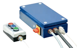
Řídicí jednotka KSS 01 380 / 400 V - 50 / 60 Hz