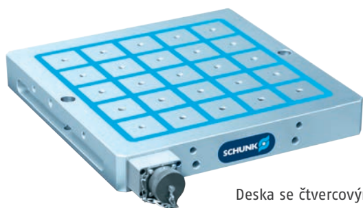
Deska se čtvercovými póly