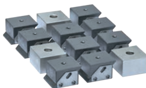
Pólové nástavce - pro každý tvar obrobku